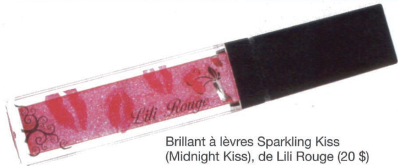
Brillant à lèvres Sparkling Kiss (Midnight Kiss), de Lili Rouge (20 $)