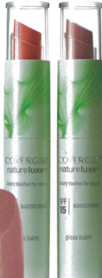
Baume brillant NatureLuxe (Grès), de CoverGirl (11,99 $)