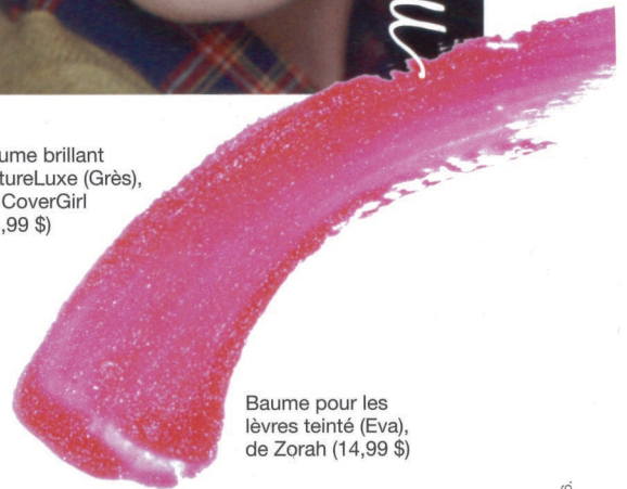
Baume pour les lèvres teinté (Eva), de Zorah (14,99 $)